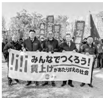
アピールデモ模様①