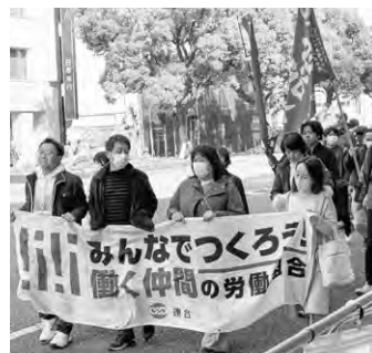
アピールデモ模様②