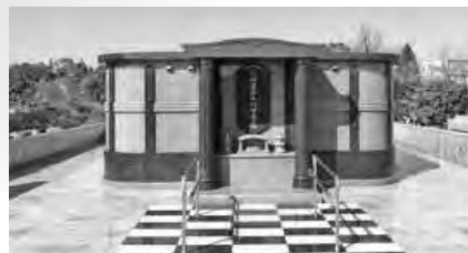
永代供養墓 (合葬墓)

永代供養墓には、骨壺を安置する合葬墓と、粉骨したご遺骨を合祀し、供養する合祀堂があります。また、正面には、お参りのための香炉、花立て等が設置されています。側面には墓碑銘プレートを設置する銘碑が設けられています。