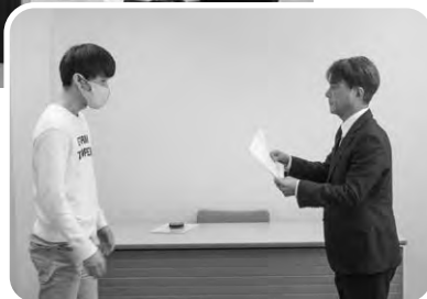
終了証証明書授与の様子