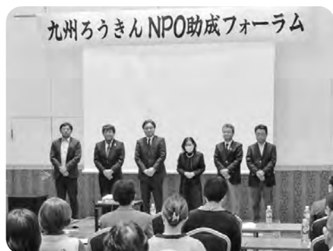
審査委員会の紹介

最後に、審査委員の出水様の閉会の挨拶で会が終了しました。九州ろうきんのNPO助成