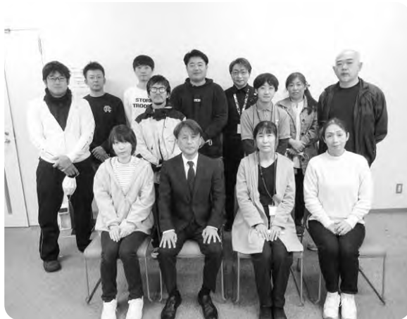
会長および講師と受講生