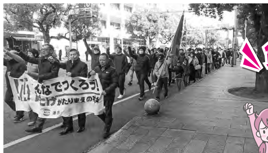
アピールデモ模様③