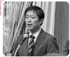
熊本県商工労働部政策審議監 兼商工雇用創生局長佐崎氏