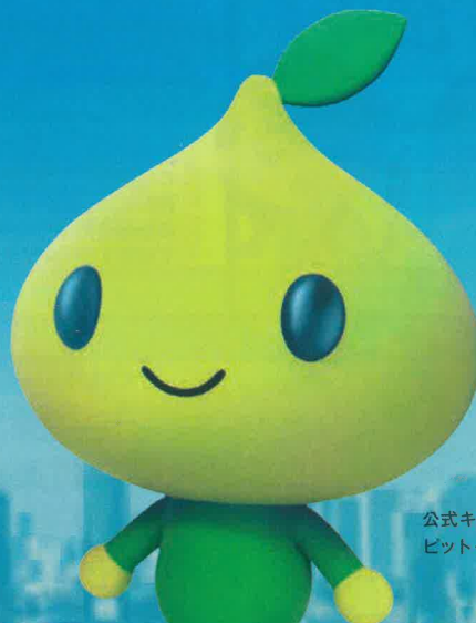
公式キャラクター ビットくん