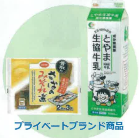
プライベートブランド商品