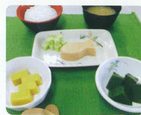
介護療養食（ムース食）