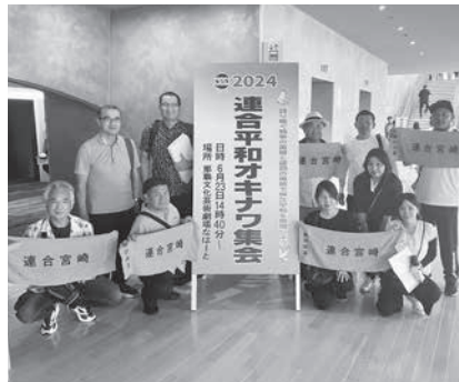
連合・平和オキナワ集会