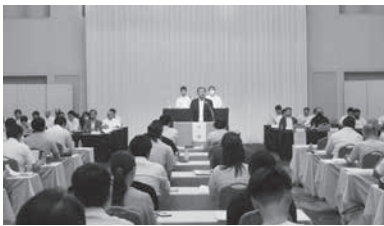
第66回通常総代会 第7回組合員代表者会議の様子② 議案審議