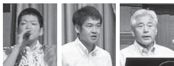
沖繩ろうきん内間支店長代理 こくみん共済松本課長 麻生幹事