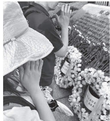
連合・被爆者死没者慰霊式