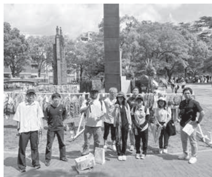
西諸地区会議からの折り鶴を献納