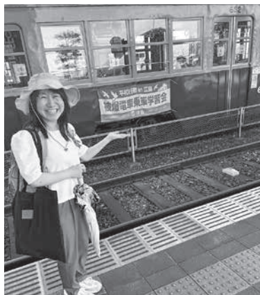
被爆路面電車学習会