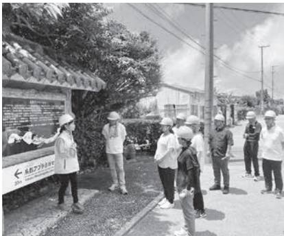
糸数アブチラガマ