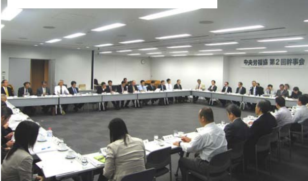
政策・制度要求を決定した第2回幹事会

し二〇〇四年に裁判所法が改定され、本年十一月からはこの給費制(給与)が廃止され、生活費等が必要な修習生には最高裁判所が一定金額を貸し付ける「貸与制」に変更されることになっている。四年制の大学を出て法科大学院(原則三年)に入り、司法試験に合格してもさらに一年間、親のすねをかじるか借金に頼って実務研修を受けなければならないことになるのである。