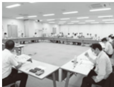
推進委員会の様子

ネットバンキング(団体向け)活用報告」と題し、書記局での活用状況や実際に体感した利便性等について講演があり、各推進委員会で導入会員をはじめ未導入会員への利用促進を図っていく必要があることが確認されました。