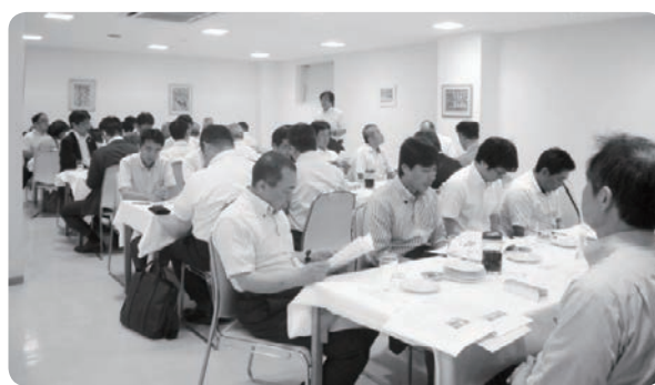
真剣に議案審議中