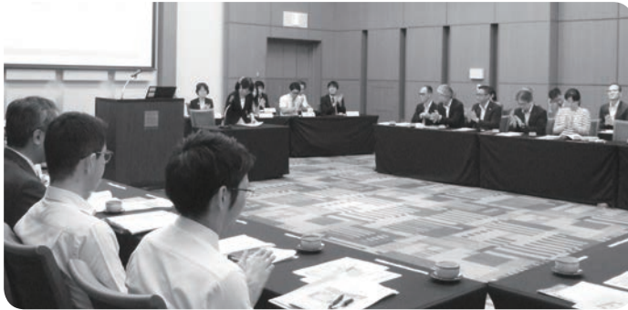
12人の代議員が活発に発言

鹿児島県生協連は6月27日、第35回通常総会を開催しました。総会では、「第1号議案 2016年度活動報告・事業報告 決算および剰余金処分案承認の