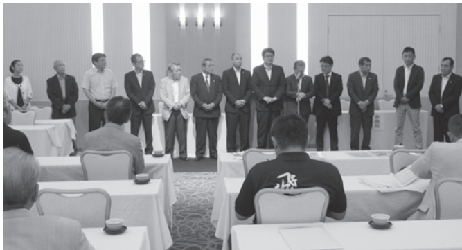
▲キャンペーン表彰工場

6月15日(木)にホテルレクストン鹿児島で『全労済指定整備工場鹿児島県協議会第25回総会』『全労済鹿児島県自動車分解整備事業者共済代理店会第4回総会』を開催しました。 総会の中では、協議会・代理店会それぞれの2016年度活動報告、2017年度活動方針(案)の議案審議を行い、各議案とも満場一致で承認を受けました。 前年度と比べ、車検・修理・点検などの入庫台数や、自賠責共済発行件数が伸びており、2016年度入庫目標を達成することができました。 また、総会後には2016年度年度末総仕上げキャンペーン表彰を行い、13代理店が表彰されました。7月と8月は共済代理店スタートダッシュキャンペーンを実施しますので、車検はぜひ全労済の指定整備工場をご利用ください。