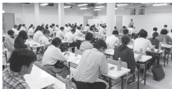
鹿児島地域推進委員会の様子

2017年度の推進活動の展開にむけて、各地域推進委員会を開催しました。 皆さまのご参加ありがとうございました。今後とも、各地域における「労済運動の発展」に向けて、ご協力をお願いします。