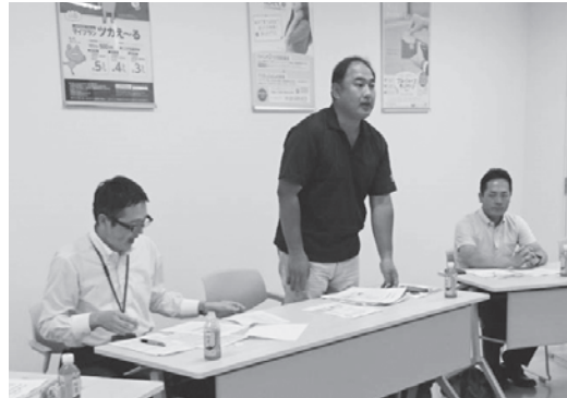
提案を行う美坂推進委員長

恒例となる「会員推進機構永年功労者」への表彰は、九州全体で26人、県内では大島・霧島・志布志支店の3支店推進委員会で行われ、長年にわたる推進活動に対する感謝の意を表し、下記の4人に感謝状と記念品を贈呈しました。 推進活動こそが労働金庫の最大の財産であることを認識し、会員・労働者が築かれた「信頼」という礎を後世に残していくことの重要性を再確認するに至りました。 表彰された皆さま、本当に