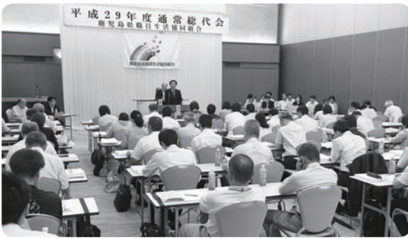
平成29年度通常総代会の様子