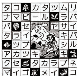
答え「ヤマビラキ (山開き)」

「お詫び」 本誌679(6月15日)号・8面の「ろうふうきょうクイズ」の「解き方」で誤りがありました。 二重ワクの6文字をうまく並べてできる言葉は?という出題は、正しくは二重ワクの5文字をうまく並べてできる言葉は?でした。 前回応募していただいた方にお詫び申し上げます。