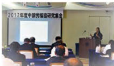
中部労働協 研究集会