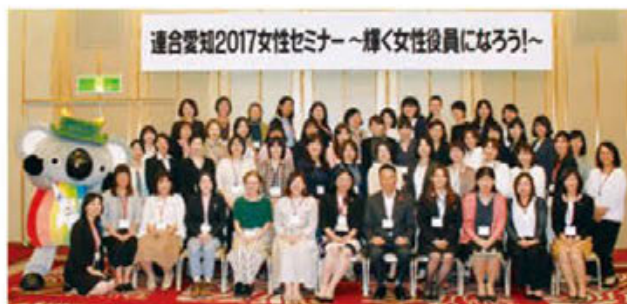
女性セミナー参加者の皆さん

その後の昼食会では、ゲームも交えながら、参加者は組織の枠を越え、それぞれの職場での課題など含め意見