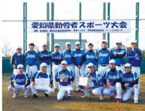
優勝 豊田自動織機労組チーム