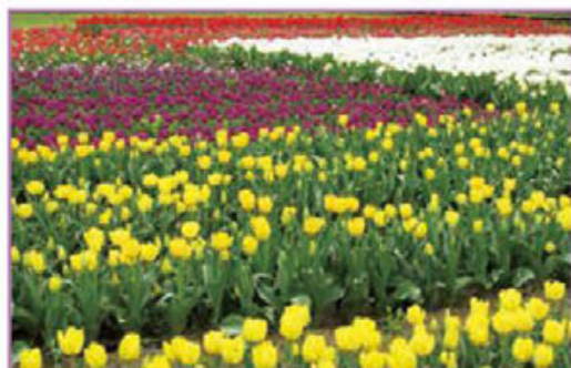
満開の頃のチューリップ畑。まるで花の絨毯のよう。奥殿陣屋は 知っていても花ぞの苑をまだ知らない人はみんな驚く。