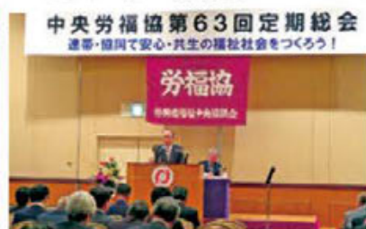
中央労働協第63回定期総会