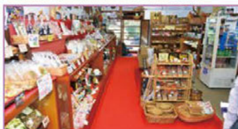
書院の奥にあるお土産物売り場には手作りアクセサリーなど や、地域の物産を各種とりそろえている。