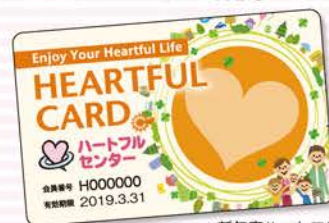
▲新年度ハートフルカード