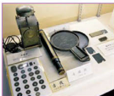
小型で精密な和時計など当時の文房具類。手の平に乗る小さな算盤は土木の計算にも使った。