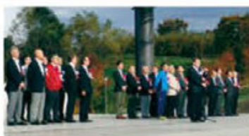
大村知事あいさつ

試合終了後、表彰式を行ない、優勝・準優勝・3位のチームには愛知県知事賞と副賞、4位のチームには敢闘賞が授与されました。