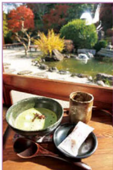
抹茶に白玉と小倉あんを加えた抹茶ぜんざい。 庭園を眺めながらのおやつは至福のひと時。