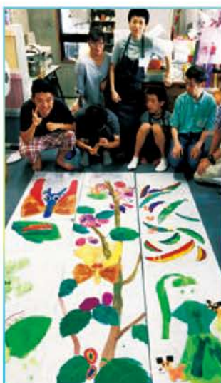
障がいを持つ人のための「あとりえ・クレッシェンド」。七夕出展の絵を合作。