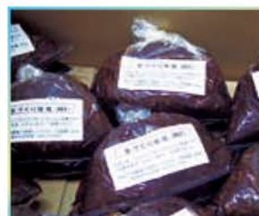
教育障がい者支援のまちなの学校農園で収穫した大豆で味噌も作る。