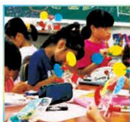
科学の学校。ゴム動力でくるくる回るタコさんづくりにみんな夢中。