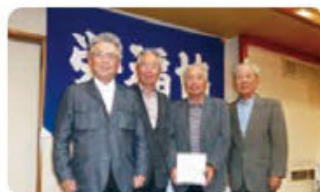
団体優勝の名古屋南支部の皆さん