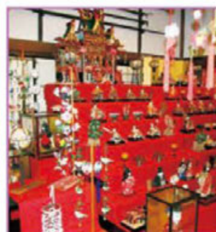
2月2日から3月4日までは書院のお座敷にたくさんの雛人形が飾られる。