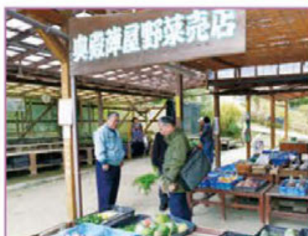
野菜の直売所には花の苗や近隣の農家での新鮮な野菜、 この梅園で取れた絶品の梅干が並ぶ。