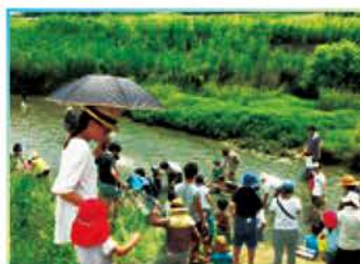
半堀川での川の学校。大人も多数参加して子どもたちと一緒に遊んだ。