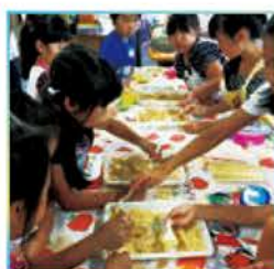
まちなの学校。きな粉をまぶしておやつわらび餅作りに挑戦。