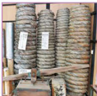
花火資料室。岡崎の花火は、家康の鉄砲隊が 故郷に帰り、火薬を平和利用したことから。