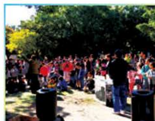
森の学校。ふだんはゲームで遊ぶインドアっ子も森の自然を満喫。