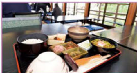
四季折々の季節限定メニューが嬉しい金鳳亭でのご馳走。 日本庭園の全景を見下ろしてお殿さま気分になる。