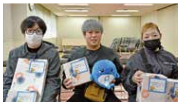
団体戦の部優勝(中津地区・THKリズム労組)