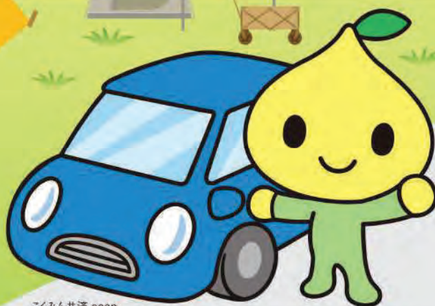
こくみん共済 coop 公式キャラクター ピットくん