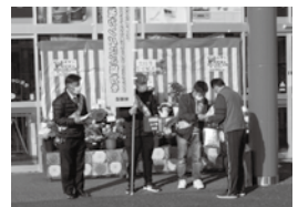
街頭カンパを実施