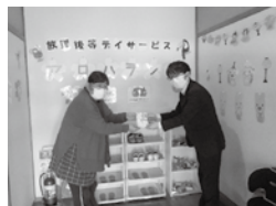
福祉施設5施設へ寄付