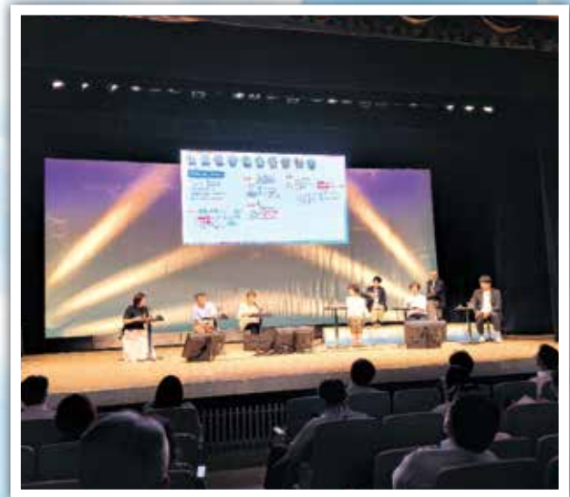
中央労福協主催 「2023年度全国研究集会in愛媛」 Hybrid開催