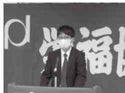
総会で久米支部長あいさつ