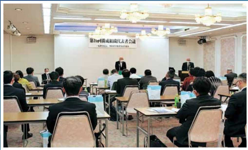
鳥取県労福協 第10回構成組織代表者会議を開催