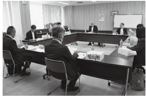
第18回定時評議員会