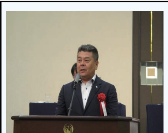
来賓を代表して高藤会長よりご挨拶をいただきました。