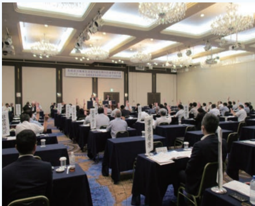
総代および組合員代表者の皆さまに議案を審議いただきました。