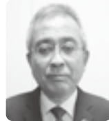
九州労働金庫宮崎県本部 本部長

新年あけましておめでとうございます。新しい年がみなさまにとりまして、より佳き年となりますよう心よりご祈念いたします。常日頃より、連合宮崎へのあたたかなご理解・ご協力に心から感謝申し上げます。新型コロナウイルス感染症の影響が続く中、みなさまのご尽力に深く敬意を表します。連合運動方針のスローガン「私たちが未来を変える」を安心社会にむけての実現のためみなさまとともに連携し、一歩、一歩前進してまいります。