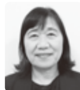
日本労働組合総連合会 宮崎県連合会(連合宮崎) 会長