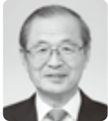
(学)みやざき福祉学園 (福)みやざき福祉園 理事長

りません。宮崎霊園は、多様化する墓地ニーズに対応しながら適切な事業運営に努めてまいります。今年もどうぞよろしくお願い申し上げます。