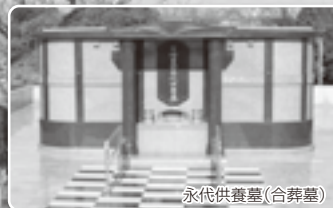
永代供養墓(合葬墓)