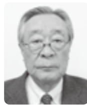
一般社団法人 宮崎県労働者福祉団体中央会 会長