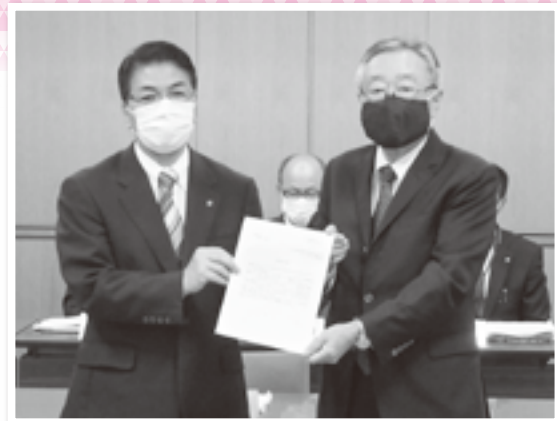
戸数宮崎市長へ要請書を手交する大久保会長