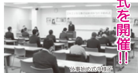
仕事始め式の様子

人だけで悩まずみんなで助け合つてこの困難を乗り越えていかなければならない。厳しい一年になると思うが、中央会を構成する九州労働金庫、こくみん共済coop、連合宮崎、みやざき福祉学園・福祉園、霊園事業団、勤労者旅行会に携わるみなさんと一緒になって力をあわせて頑張っていきたい。」と挨拶を行いました。