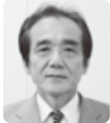
公益財団法人 宮崎霊園事業団 理事長

本年も「たすけあいの輪」を広げたいです。直に真摯に取り組んでまいります。本年も、どうぞよろしくお願い申し上げます。