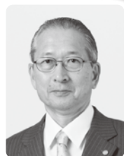
労働者福祉中央協議会